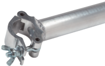
Trussaufnehmer 50 mm Länge 210 mm Code 5055 Länge 330 mm Code 5056