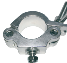
Trussaufnehmer Code 823 Trussaufnehmer für 50 mm Truss mit M-10 Gewinde. Für höchste Belastungen, Tragkraft 500 kg, 50 mm breit.