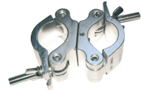
Trussaufnehmer Code 8231 Für 50 mm Truss, die Aufnahme ist verdrehbar, 50 mm breit, Tragkraft 500 kg.