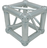
Box Corner Code F34Box für F34